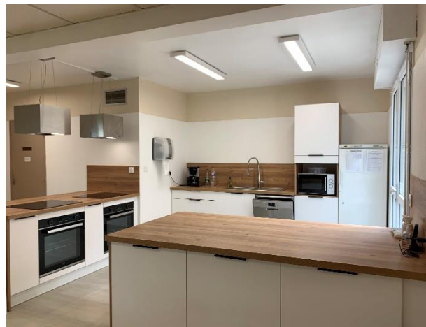
Salle à manger et cuisine